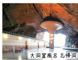
大洞窟風呂 忘帰洞

紺碧の海と緑豊かな山に囲まれた自然を身近に感じるリゾートホテル。黒潮の荒波を間近で感じる絶景洞窟温泉「忘帰洞」、山の上から町を見下ろす温泉など、一日では回りきれない程の種類豊富な温泉をお楽しみ下さい（公式HPより）。