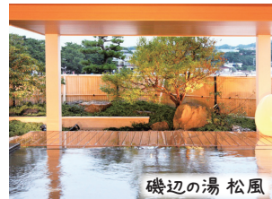
1泊目・南紀白浜温泉／白良荘グランドホテル

あふれる陽光、紺碧の海、そしてまばゆいばかりに白い砂浜。日常の中に置き忘れた時間がここにはあります。この時のこの場でしか味わえない一期一会の至高のひとときを、白良荘グランドホテルで心ゆくまで堪能下さい（公式HPより抜粋）。